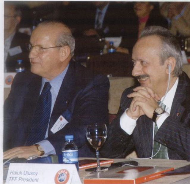
Haluk Ulusoy TFF President

mekte, ama yine de teyakkuzu elden bırakmamalıyız" diye konuştu. Açılış töreninde, geçtiğimiz günlerde vefat eden efsanevi Macar futbolcu Ferenc Puskas da anıldı. Açılış töreninden önce düzenlenen basın toplantısında konuşan TFF Genel Sekreteri Lutfi Arıboğan ise bundan önce hep sportif organizasyonlar gerçekleştirdiklerini belirterek, "Bu bizim için bir ilk. Dünyada, sporda ve futbolda sağlık konusunun en çok tartışıldığı günlerde UEFA Sağlık Sempozyumu'nun İstanbul'da gerçekleştiriliyor olması dünya, Avrupa ve Türk futbolu için çok anlamlı" diye konuştu. Arıboğan, bu ay içinde de kulüplerdeki sağlık personelinin eğitimiyle ilgili çok önemli bir toplantı organize edeceklerini kaydetti. UEFA Sağlık Kurulu Başkanı Urs Vogel ise genç yaşta sporcu ölümleriyle ilgili olarak, UEFA'nın yeni bir kulüp lisans prosedürü olduğunu ifade ederek, "Bu lisans 2008 itibarıyla yürürlüğe konulacak. Kulüplerin yapacağı sağlık muayeneleriyle ilgili ülke federasyonlarına bazı tavsiyelerimiz olacak. Kulüpler bütün ön koşullara uydukları zaman lisans verilmesine izin verilecek" diye konuştu. FIFA İcra Kurulu Üyesi ve Sağlık Kurulu Başkanı Michel D'Hooghe da milli takımlarda sakatlanan oyuncularla ilgili FIFA'da Barcelona Kulübü Başkanı Joan Laporta başkanlığında bir çalışma grubu kurulduğunu kaydederek, "Bu konuya daha fazla Avrupa takımları tepki gösteriyor. Bu çalışma grubuyla